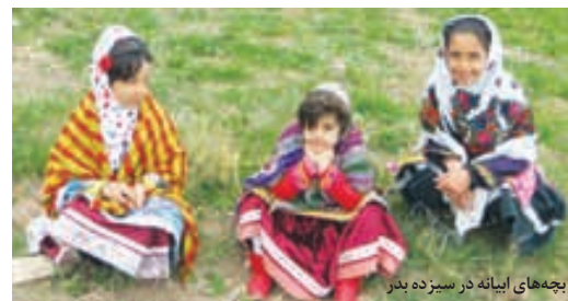
بچه‌های ایبانه در سیزده بدر