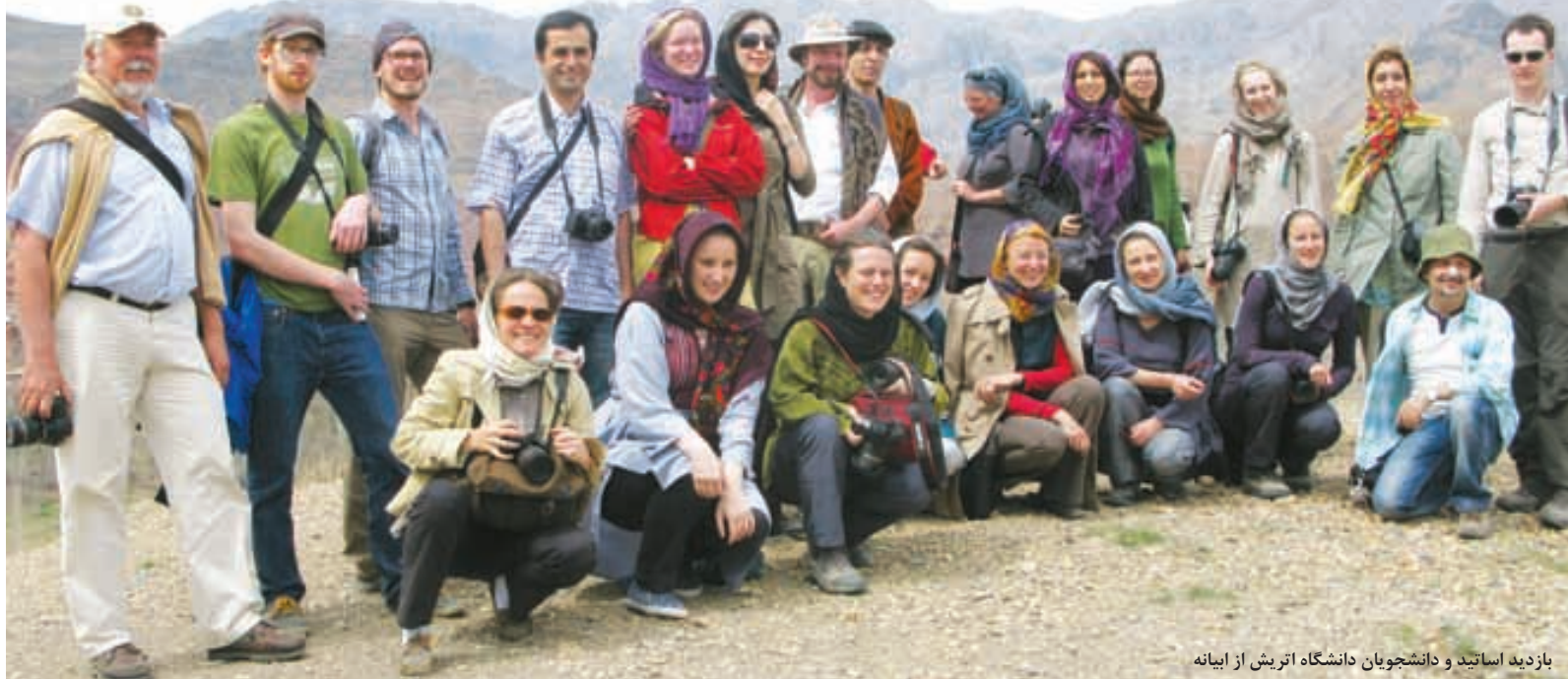
بازدید اساتید و دانشجویان دانشگاه اتریش از ایبانه