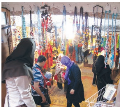
احداث بازارچه محلی، فرصت شغلی مناسب و مساوی برای اهالی فراهم می‌کند

باغ‌ها و دشت و کشت و زرع ایبانه دیری است که رو به افول نهاده است. سالمندان