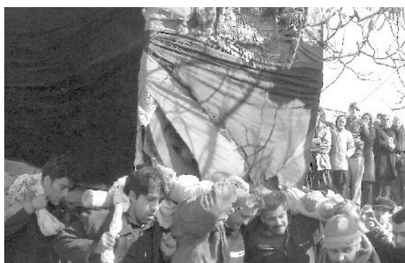
حمل‌کنندگان نخل مالک پایه‌هایی هستند که بر دوش آنها قرار دارد و این مالکیت به ورثه آنان به ارث می‌رسد

روزهای تاسوعا و عاشورا بر روی نخل بنشینند. این شخص وظیفه هدایت نخل را در کوچه‌های باریک روستا و ممانعت از برخورد آن با دیوارها و شاخه‌های درختان از طریق فرمان دادن به کسانی که آن را حرکت می‌دهند برعهده دارد. همچنین در غروب روز عاشورا اطعام عزاداران و گروهی که وظیفه جابجایی و انتقال نخل را در دو روز گذشته برعهده داشته‌اند بر عهده این شخص است. این مالکیت به‌عنوان یک ارزش اجتماعی در ایبانه مطرح می‌باشد.