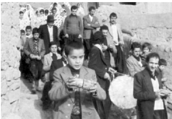
دسته عزاداری جفجغه‌زنی محله یسمان

در ده ایبانه شروع ماه محرم با هیجان‌ات روحی و رقابت‌های مردم هر سه محل در انجام مراسم همراه بوده است. در شب اول دهه نخست ماه محرم، مساجد محل‌های سه گانه (پائین ده - یسمان و پل) به وسیله جوانان این محل‌ها با شور و هیجانی خاص آراسته و آماده می‌شود. روضه‌خوانی ده دوازده روز این ماه از اولین شب محرم شروع و مردم هر محل در جلسات روضه مسجد خود شرکت می‌کنند. تا چند سال دو نفر واعظ و روضه خوان محلی بودند که مجالس