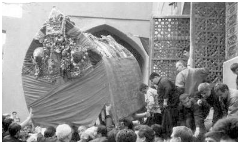
نخل محله برازه (پل - یسمان) هنگام خروج از حسینیه محل نگهداری آن

مردم محله یسمان در این روز (تاسوعا) دو برنامه دارند، یکی جغجغه زنی و پرسه رفتن و دیگری برداشتن «شده» به فتح شین و تشدید دال. جغجغه (جک جکه) دو چوب استوانه‌ای به قطر شش سانتیمتر و طول تقریبی هفت سانتیمتر است که یک سطح آن صاف و مسطح است و گاهی اوقات در وسط سطح مقابل که کمی برآمده است حلقه‌ای با ریسمان تعبیه شده است که انگشت میانی وارد این حلقه شده و هر استوانه را در کف دست نگاه می‌دارد. اعضاء دسته