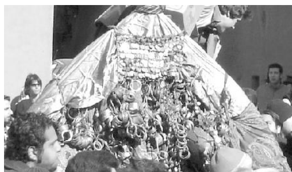
زیورات نخل و نذوراتی که اهالی در مواقع توقف نخل در مسیر حرکت به سرنشین آن می‌دهند

نخل ایبانه نمادی است از عزاداری ماه محرم در بزرگداشت قیام امام سوم شیعیان حسین بن علی (ع) که در سال شصتم هجری در صحرای کربلا در مصاف با لشکریان یزید بین ذلت و شهادت، دومی را برگزید تا در طول تاریخ شاهدی باشد بر حقانیت و غلبه حق بر باطل و پیروزی خون بر شمشیر. آنچه جالب توجه است آنکه این نماد در ایبانه در مالکیت افراد خاصی قرار داشته و دارد که پس از گذشت ایام و با فوت مالکین نخستین، این مالکیت به ورثه آنان به ارث رسیده است. بر این اساس، نظامی معین و معلوم، نحوه کارکرد نخل و اداره امور آن را به‌عنوان نماد عزاداری ایام محرم در ایبانه تعریف می‌کند. در ایبانه افراد مشخصی با نخل سروکار دارند. برخی از آنان به‌صورت سالانه تغییر می‌کنند و برخی دیگر به‌صورت ثابت از یاران نخل محسوب می‌شوند. «بابا»ی نخل فردی است که نگهداری از آن را در زمان عدم استفاده برعهده دارد. نگهداری و مرمت محل استقرار نخل (حسینیه نخل)، نگهداری و مراقبت و محافظت از وسائل متعلق به نخل و انجام مرمت‌های مورد نیاز در مورد خود نخل از جمله وظایف «بابا»ی نخل است.