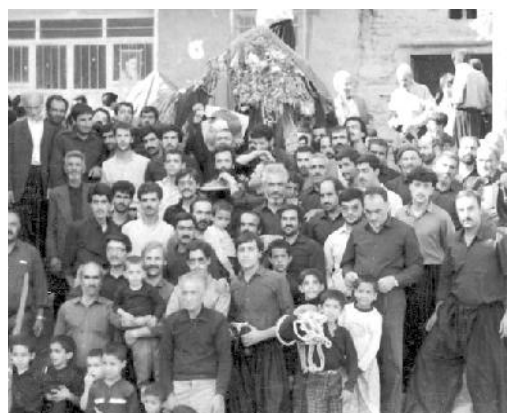
نخل محله پائین ده به همراه گروهی از ایبانه‌ای‌ها

سواره و پیاده همه دست کین گشاده دو هزار در یسار و دو هزار در یمین است